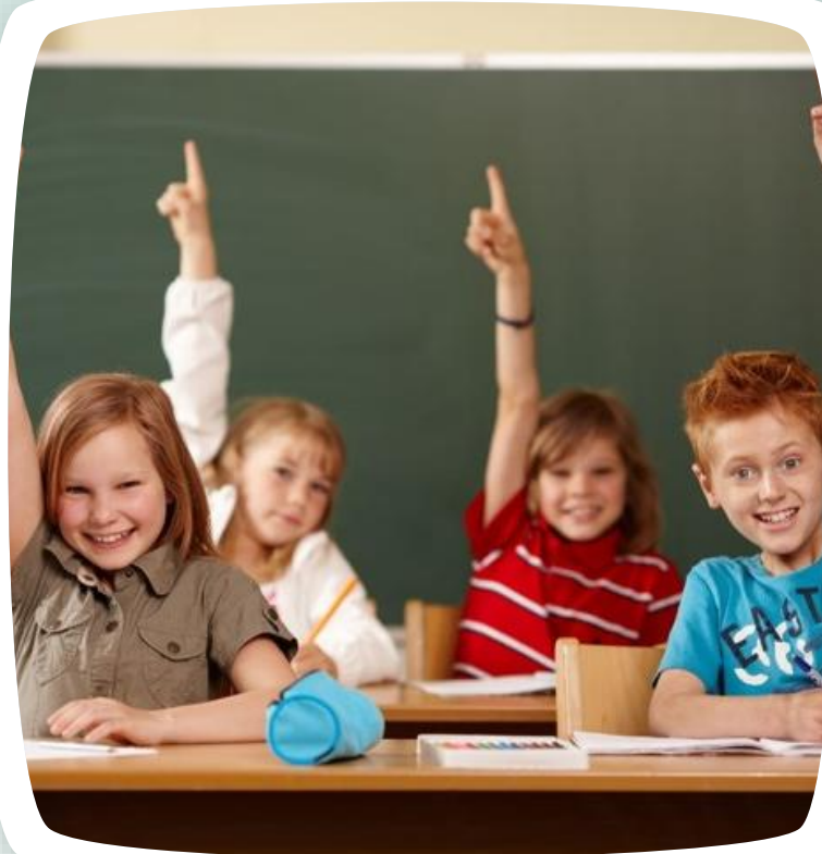
PRIMARIA (1º a 6º de primaria)

La actividad se desarrolla en grupos por edad y (si el número de alumnos lo permite) en subgrupos para adecuar el aprendizaje a las capacidades de los alumnos.