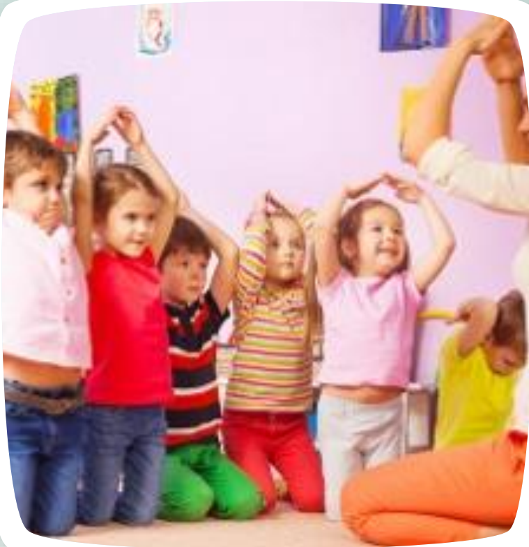
INFANTIL (3,4 y 5 años)